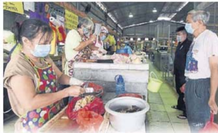
民众继续“扫货日常”，加上营业的巴刹太少，导致小贩的工作量倍增，有者为了避免过劳发病而计划歇业！