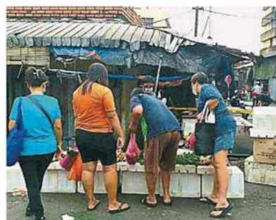
↑ 记者发现, 仍有不遵守限令的小贩在巴刹露天部分摆摊, 并在执法人员到场后, 抛下货物, 逃之夭夭。

也有人说, 目前巴刹都在限定时间内营业, 除非休息日, 所以民众无需担心买不到食材。