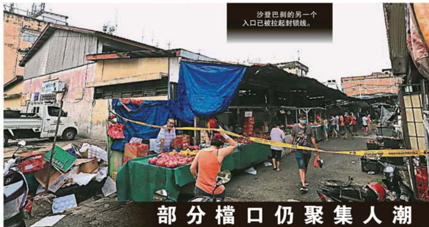
沙登巴刹的另一个入口已被拉起封锁线。