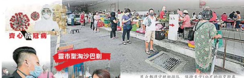
民眾進入靈市聖淘沙17/27路巴剎前，需測量體溫及洗手。