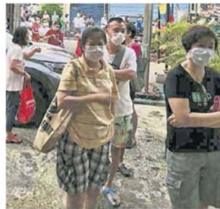
排队的消费者都戴上口罩。