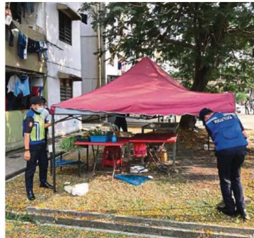
Makeshift tents set up by foreigners being dismantled at Bandar Sultan Suleiman, Port Klang, by MPK enforcement officers.