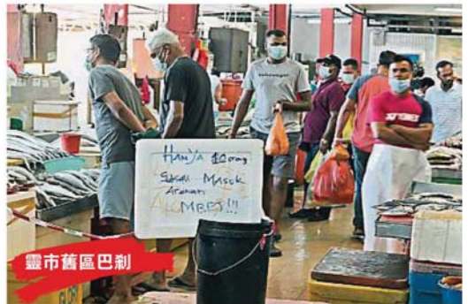
尽管灵市田區奧曼路巴剎限制10人先後進入，惟現場并没民眾理會這項條例。

她说，行动管制期其实还剩下10天左右，大家应该在这段时间与家人好好相处，促进彼此的关系，也可趁机学习烹饪及其他技能，让生活变得更充实。