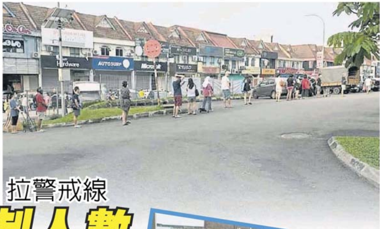
消费者即使在马路排队，都保持社区距离。