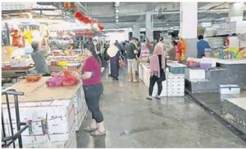
雪隆许多巴刹都限制进入巴刹的人数，避免过度拥挤而遭到执法组的关闭指示。