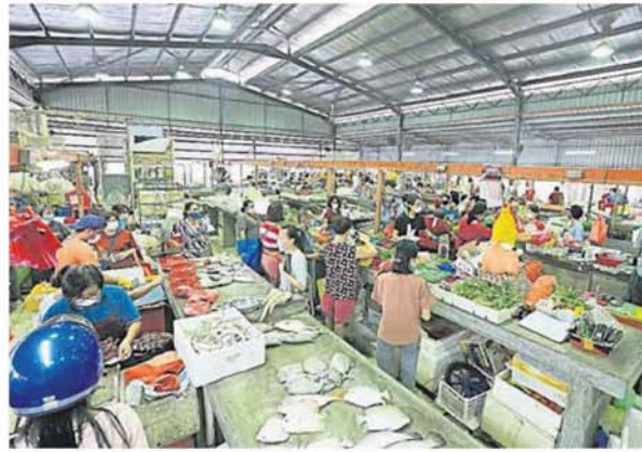
■经过地方政府实行进一步严厉措施后，巴剎的拥挤人潮大为减少。

(八打灵再也22日讯) 雪州政府昨日发布一项附加管制措施，雪州各地区巴剎今早开始执行人潮管制，各地方执法人员巴剎维持秩序，监控购物人潮。