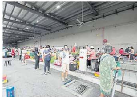
■在巴剎外等待的顾客，排队时都保持距离著一公尺的规订。

每户只许一人购物 士拉央市议会主席三苏沙里尔发文指出，市议会出动了35名官员，分别来自执法与安全组、执照组、固体废物及卫生组，监控公共巴剎的人潮流动。