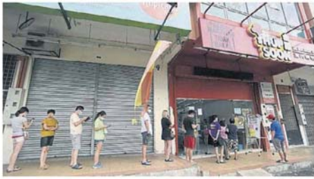
除了公共巴刹外，沙登一带的猪肉店大排长龙，部分民众遵照社交安全距离，人与人之间保持一公尺的距离。

Provided for client's internal research purposes only. May not be further copied, distributed, sold or published in any form without the prior consent of the copyright owner.