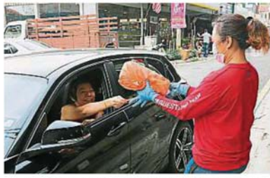
部分购买少量物品的民众在向小贩下单后，只需在巴剎旁停车一会儿，再取货及还钱，即可离开。