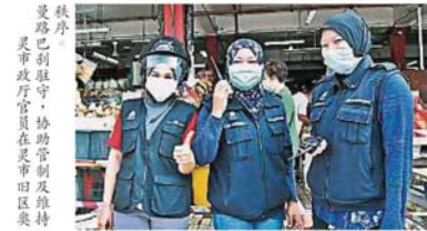
秩序 靈市聖淘沙17/27路巴剎駐守，協助管制及維持