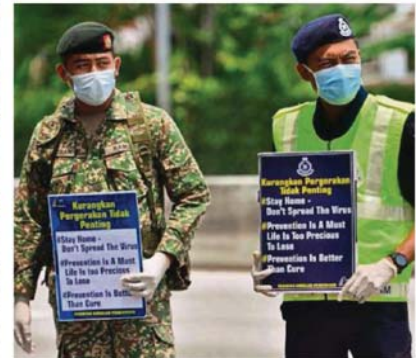
Combined forces: Policemen and Armed Forces personnel manning roadblocks in Kuching (left) and near Desa Sri Hartamas in Kuala Lumpur.

He told them the country was now facing a health crisis and it was their duty to work together to help society better protect itself