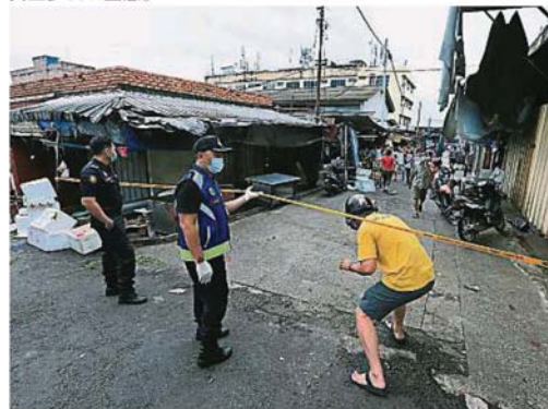
执法人员劝民众不要逗留在外, 购买完后尽快回家。