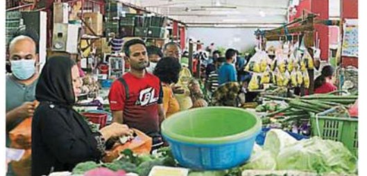
靈市田區奧曼路巴剎有約200個檔口營業，現場十分拥挤。

由于有些民众误该巴剎只在今日营业，因此他再次重申，该巴剎将于周二至周日的早上5时至中午12时营业。