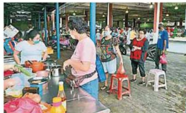
双溪威巴刹的民众遵守一公尺社交距离的指示，守秩序地排队购物。

（八打灵再也22日讯）雪州政府于昨日发布一项附加管制措施后，雪州各巴刹今早纷纷进行人潮管制。各地方政府执法人员也到巴刹维持秩序，严格监控巴刹人潮。 在全国落实行动管制令前几天，各巴刹几乎都挤满人潮，民众因担心买不到食材而蜂拥至巴刹抢购，部分巴刹甚至引起当局高度关注，派员疏散人群。 据《大都会》社区报了解，雪州各地方政府今日都采取紧急应对措施，限制巴刹内的人潮及购物时间，避免区内的巴刹出现人潮拥挤问题。