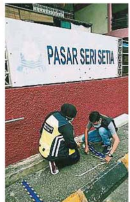
八打灵再也市政府官员周六在双溪威巴刹外贴上一公尺距离的排队线。

他说，灵市政府官员昨天前往拉起警戒线，并在地上贴上一公尺距离的排队线，今早也派出卫生组执法人员前往维持秩序，情况控制良好，巴刹运作一切顺利，人潮也不多。