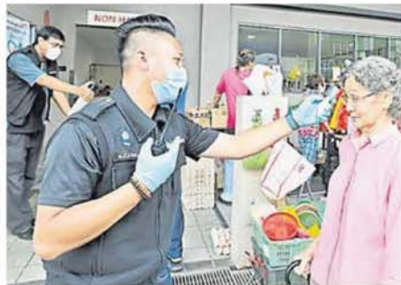
■官员在巴剎入口处理现场检验购物者的体温，严格执行雪州政府的附加措施。

一名官员表示，虽然人流减少，但还是欠理想。当地一些民众的防疫意识不高，一些人像没事一样到处走动。有些小贩不遵守限令，照样露天摆摊，看见执法官员来到，就马上逃掉。(ITE)