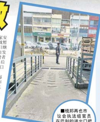
梳邦再也市议会执法组官员在巴刹的进出口把关，避免有者混入巴刹内。

位于孟沙的TMC迷你超市也指定每次只会开放让10名消费者进入超市购物，驻守的保安人员将会负责点算进出超市的人数，避免超市出现“超标”的情况，同时也促请消费者在收费柜台排队付款时也必须保持社区距离。