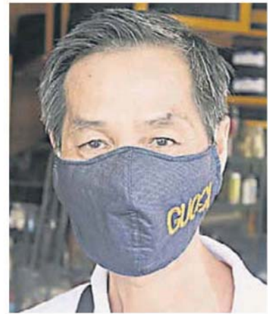
李金就：让一半员工回来营业。

他坦言，早上开门时，上门的车主不多，大多数是必要服务领域的车，并有向客户坦言，只限一般维修，因许多零