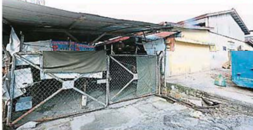
↑ 通往沙登巴刹的其中一个入口大门在星期六(21日)被锁上。

沙登巴刹早前因售卖猪肉的区域出现人群过于拥挤, 而被警员勒令停止营业, 加上该巴刹因昨午拉上封锁线后, 让许多民众误以为巴刹不能营业; 小贩声称今日巴刹人潮减少, 有者流失至少50%生意。