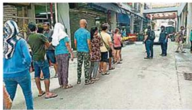
万撓巴刹只开放一个入口，每次只允许15人进入买菜，民众在巴刹外排队等待进入。