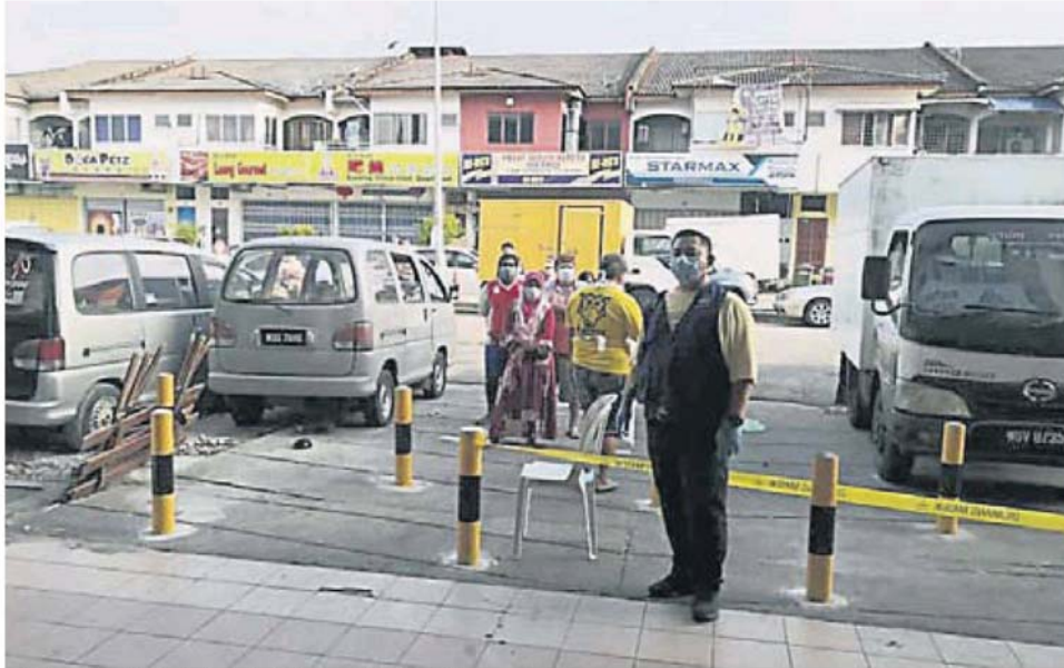
官员在门口把守进入的人数。