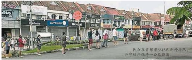
民众在首邦市SS15巴刹外排队，并守秩序保持一公尺距离。

（八打灵再也22日讯）雪州政府于昨日发布一项附加管制措施后，雪州各巴刹今早纷纷进行人潮管制。各地方政府执法人员也到巴刹维持秩序，严格监控巴刹人潮。 在全国落实行动管制令前几天，各巴刹几乎都挤满人潮，民众因担心买不到食材而蜂拥至巴刹抢购，部分巴刹甚至引起当局高度关注，派员疏散人群。 据《大都会》社区报了解，雪州各地方政府今日都采取紧急应对措施，限制巴刹内的人潮及购物时间，避免区内的巴刹出现人潮拥挤问题。