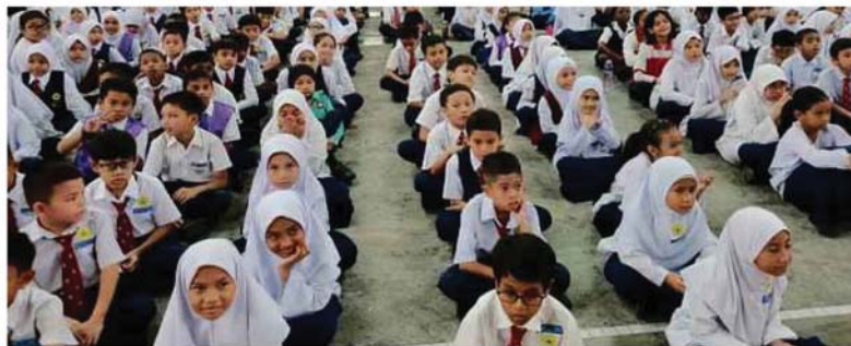
Murid-murid mendengar taklimat ketika pelancaran NILAM Nafas Baharu peringkat daerah Sepang tahun 2020 yang dijalankan di SK Cyberjaya, baru-baru ini.

dijalankan di PSS dalam melahirkan lebih ramai murid yang cinta akan buku sekali gus suka membaca seterusnya dapat melahirkan modal insan berpengetahuan tinggi dan luas," katanya.