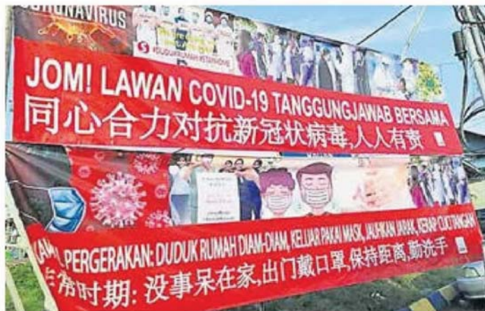
■适耕庄的抗疫横幅有著：同心协力对抗新型冠状病毒，人人有责。

至于一些因管制令而“手停口停”的民众，若有需要，其服务中心会资助一些日常用品和款项。目前已有几户巫裔家庭受惠，他表示会陆续帮助有需要的人士。(TTE)